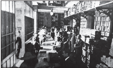
En el interior de La Colmena