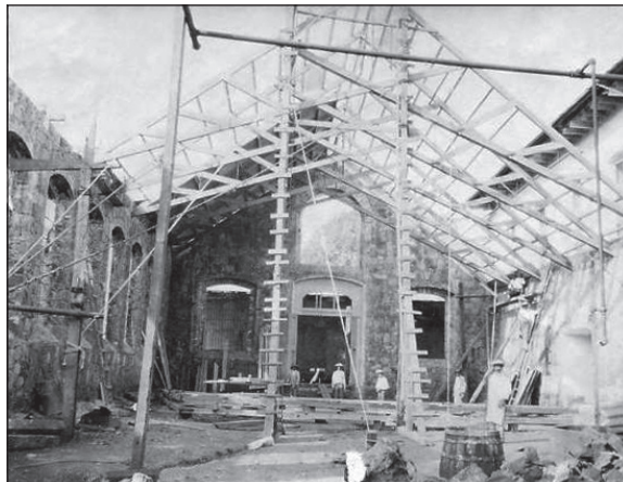
Fábrica San Pedro en construcción (1894)