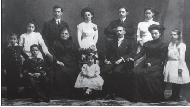
Familia Hurtado (1909)