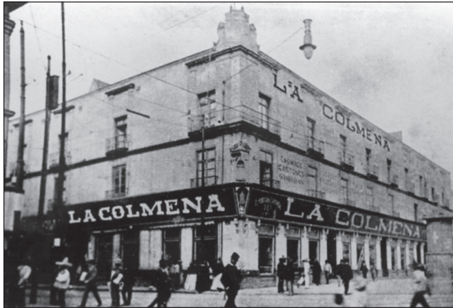
Tienda La Colmena (1910).