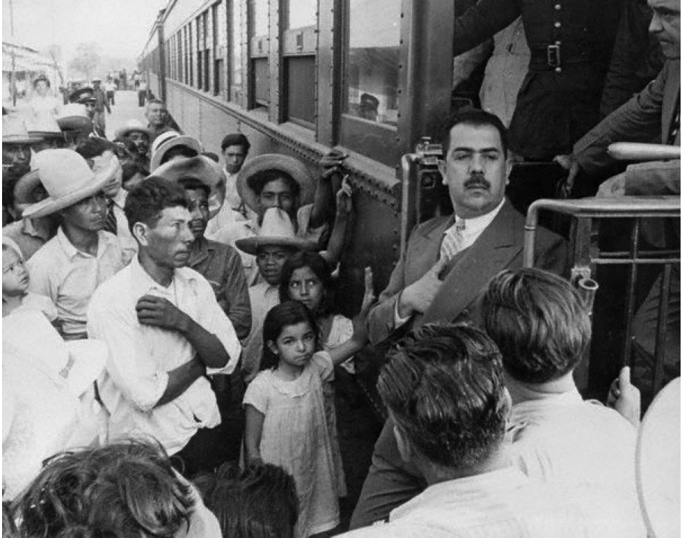
Cuando se gobernaba para los de abajo... Lázaro Cárdenas en La Laguna.