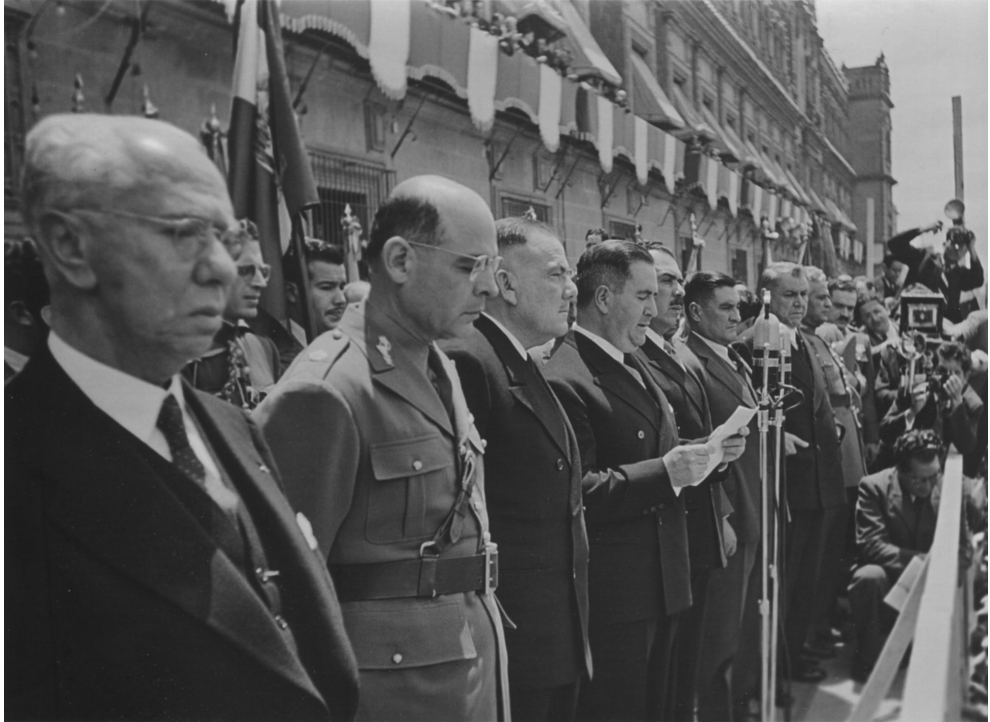
Los expresidentes Adolfo de la Huerta, Plutarco Elías Calles, Emilio Portes Gil, Pascual Ortiz Rubio, Abelardo L. Rodríguez y Lázaro Cárdenas del Río, reunidos por Manuel Ávila Camacho en un discurso conciliador de unidad nacional en septiembre de 1942, tras el ingreso de México a la Segunda Guerra Mundial.