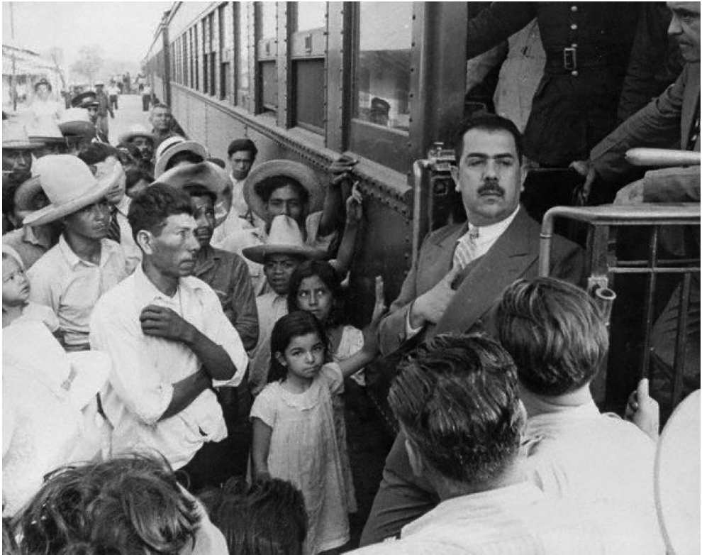
Cuando se gobernaba para los de abajo... Lázaro Cárdenas en La Laguna.