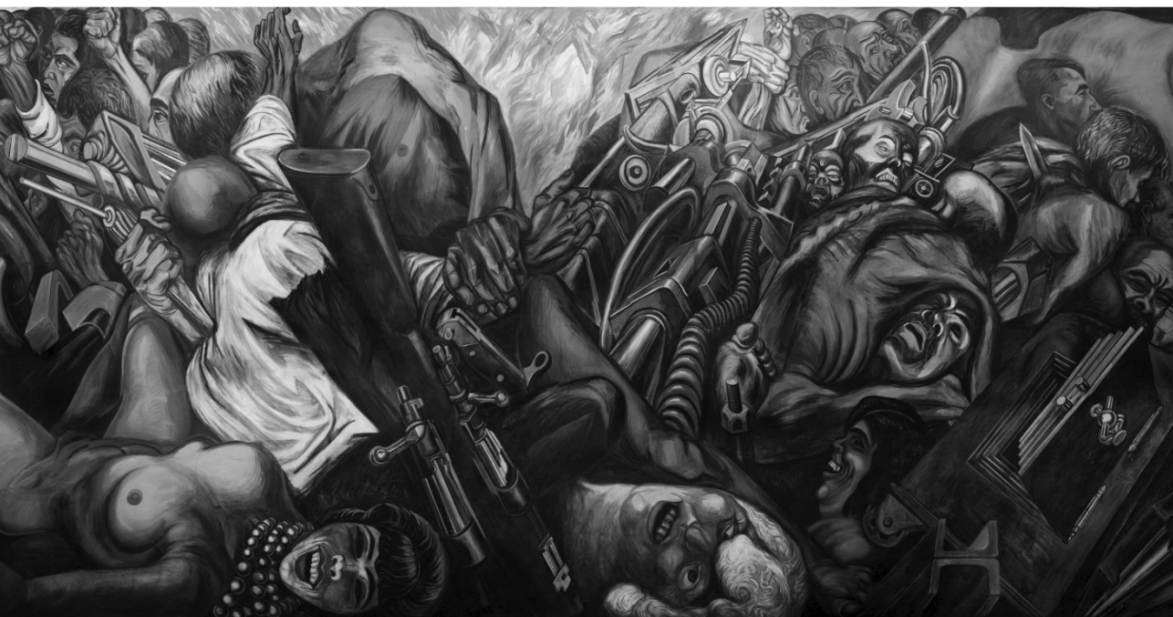
José Clemente Orozco | La Katharsis (detalle), 1934. Palacio de Bellas Artes, Ciudad de México