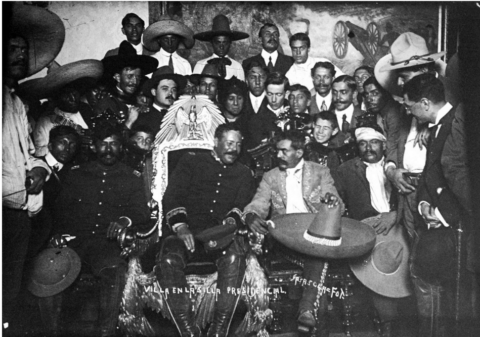
Pancho Villa, Emiliano Zapata y otros revolucionarios, tras su victoriosa entrada a la capital el 6 de diciembre de 1914, posan para la cámara en el salón presidencial de la República.