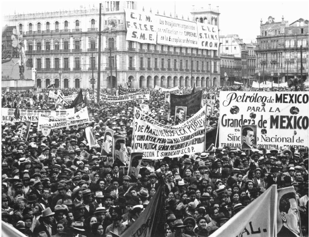
Manifestación de apoyo a la expropiación petrolera, 1938.