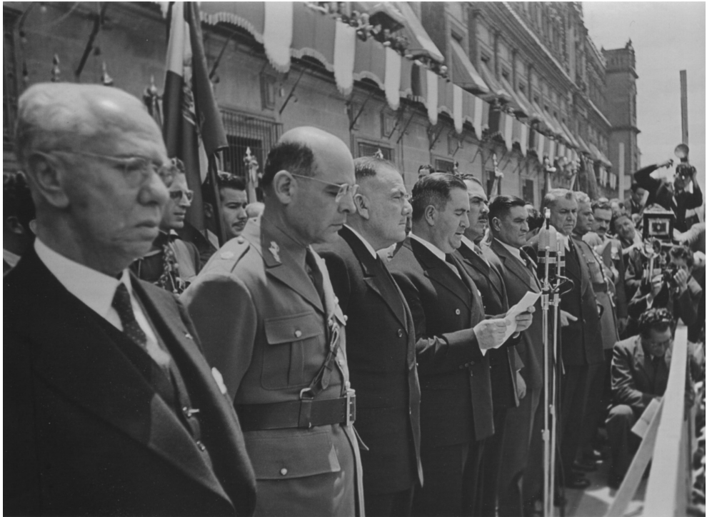
Los expresidentes Adolfo de la Huerta, Plutarco Elías Calles, Emilio Portes Gil, Pascual Ortiz Rubio, Abelardo L. Rodríguez y Lázaro Cárdenas del Río, reunidos por Manuel Ávila Camacho en un discurso conciliador de unidad nacional en septiembre de 1942, tras el ingreso de México a la Segunda Guerra Mundial.