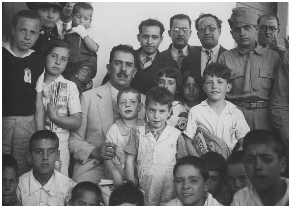
Los niños españoles refugiados y el presidente Lázaro Cárdenas, Ciudad de México, junio de 1937.

Archivo General de la Nación Archivo Fotográfico Enrique Díaz Delgado y García