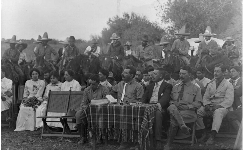
Francisco J. Múgica y Lucio Blanco hacen el primer reparto de tierras procedentes del fraccionamiento de la hacienda "Los Borregos" en Matamoros, Tamaulipas, el 30 de agosto de 1913.