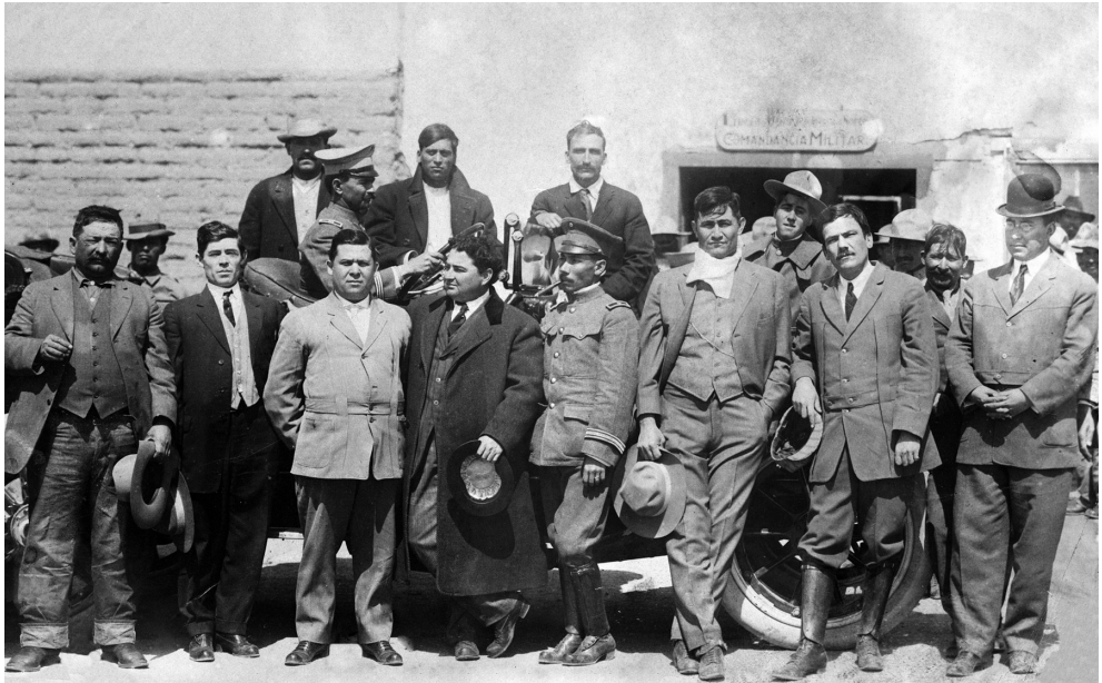
Álvaro Obregón y Plutarco Elías Calles en Sonora a principios de 1914.