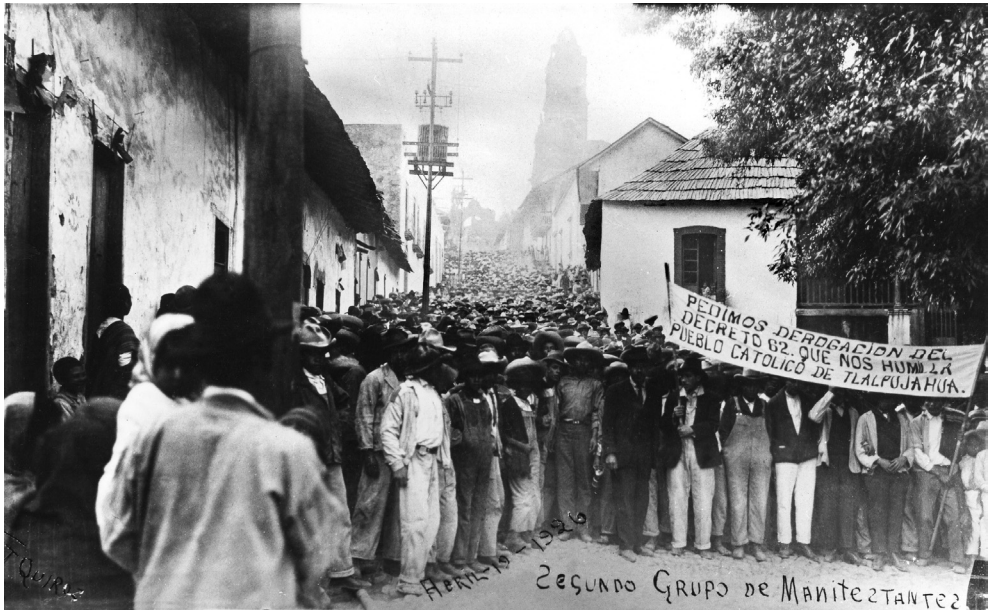
Manifestación pacífica durante la guerra cristera contra los decretos del gobierno mexicano en Talpujahuá de Rayón hacia 1926.