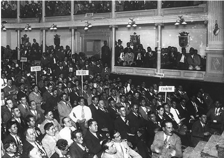
Convención constitutiva del Partido Nacional Revolucionario en 1929.