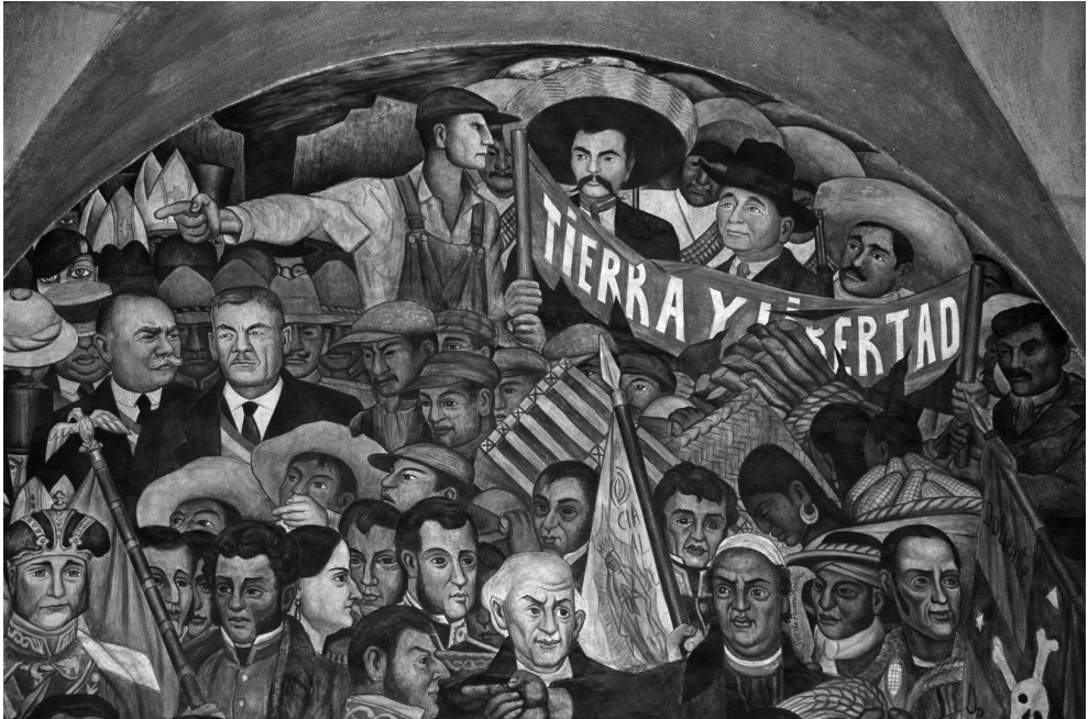
Diego Rivera | La epopeya del pueblo mexicano (detalle), 1929-1935. Palacio Nacional, Ciudad de México