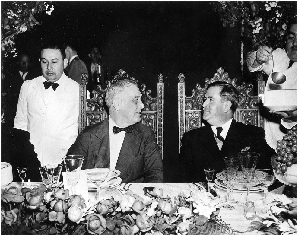
Manuel Ávila Camacho, en Monterrey, en una comida con el presidente de Estados Unidos Franklin Delano Roosevelt.