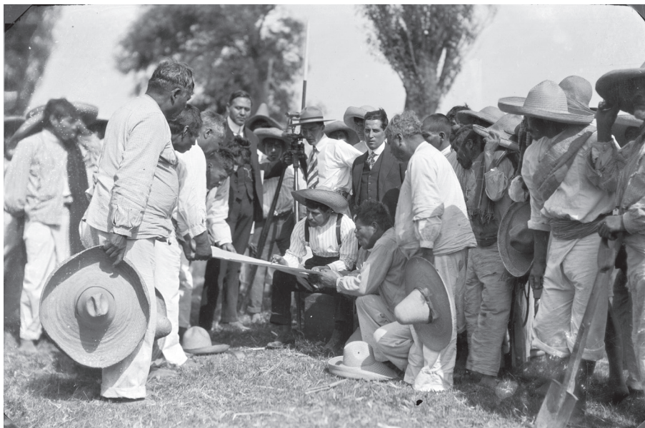
Campeños y agrimensores durante mediciones para reparto de tierras

pero su importancia para el desarrollo económico nacional no se tomó en consideración. 95