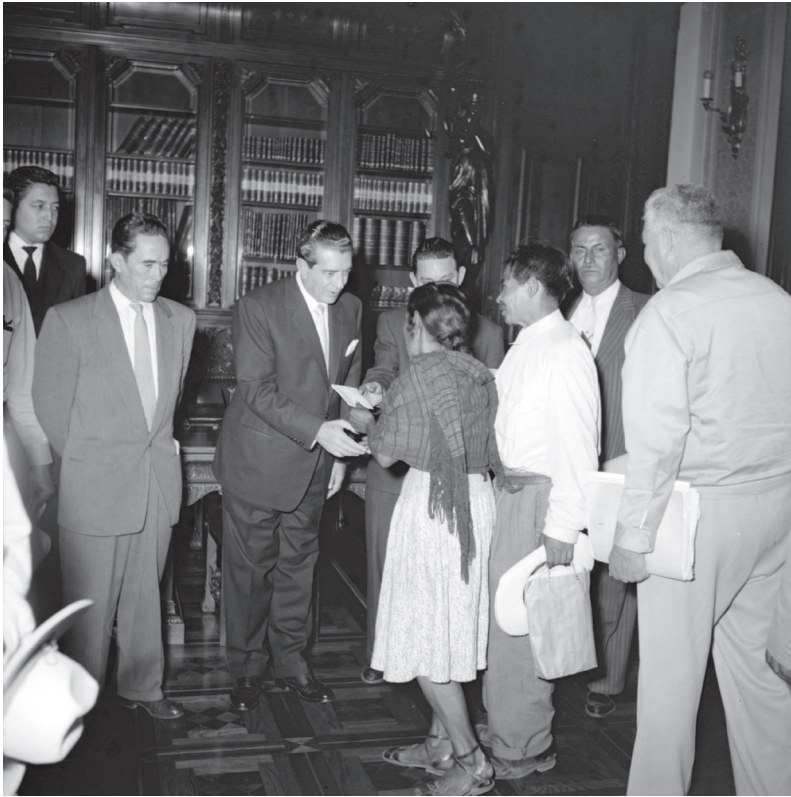
Adolfo López Mateos saluda a una campesina que lo visita en Palacio Nacional para agradecerle el reparto de tierras en Cananea