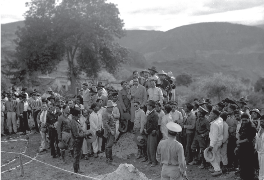
Lázaro Cárdenas con campesinos en un solar

concesiones ganaderas inafectables hasta por 25 años, y confirmó el derecho de los propietarios afectados por dotación de ejidos a recibir la indemnización correspondiente, acción que prescribía en el plazo de un año. 84