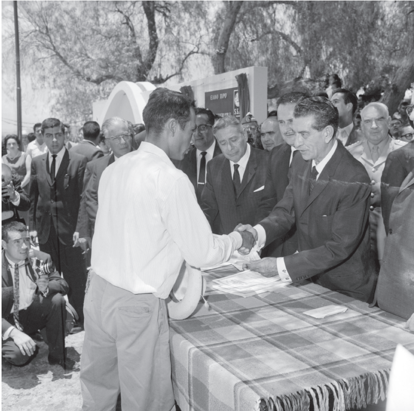
Adolfo López Mateos entrega título de propiedad a campesino, © 253822 Secretaría de Cultura, INAH, Sinafo, FN, México. Reproducción autorizada por el INAH, México.

Entre 1940 y 1965, el crecimiento de la producción agropecuaria superó al incremento de la población nacional debido principalmente a la incorporación al cultivo y al uso agropecuario de las tierras que habían sido repartidas. El riego, el crédito, la mecanización, el uso de insumos agroquímicos, y en especial los precios administrados y la compra de las cosechas por el Gobierno, elementos en los que se hizo patente la diligencia del Estado, pesaron menos que el esfuerzo de los campesinos por extender los cultivos hasta las fronteras de las tierras reformadas.