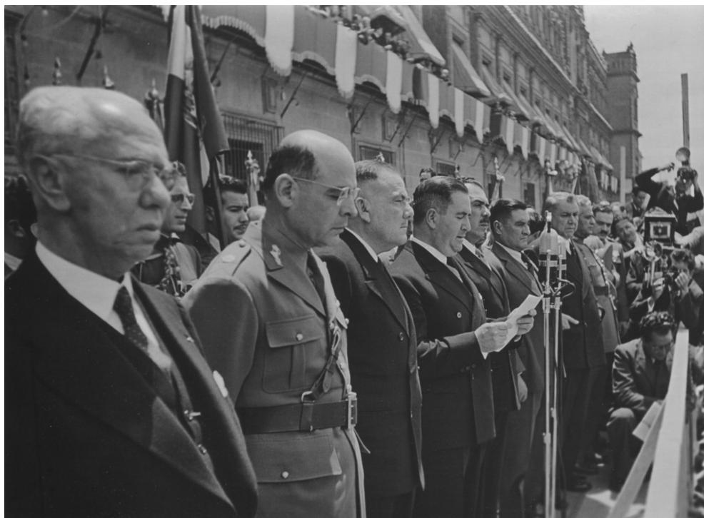
Los expresidentes Adolfo de la Huerta, Plutarco Elías Calles, Emilio Portes Gil, Pascual Ortiz Rubio, Abelardo L. Rodríguez y Lázaro Cárdenas del Río, reunidos por Manuel Ávila Camacho en un discurso conciliador de unidad nacional en septiembre de 1942, tras el ingreso de México a la Segunda Guerra Mundial.