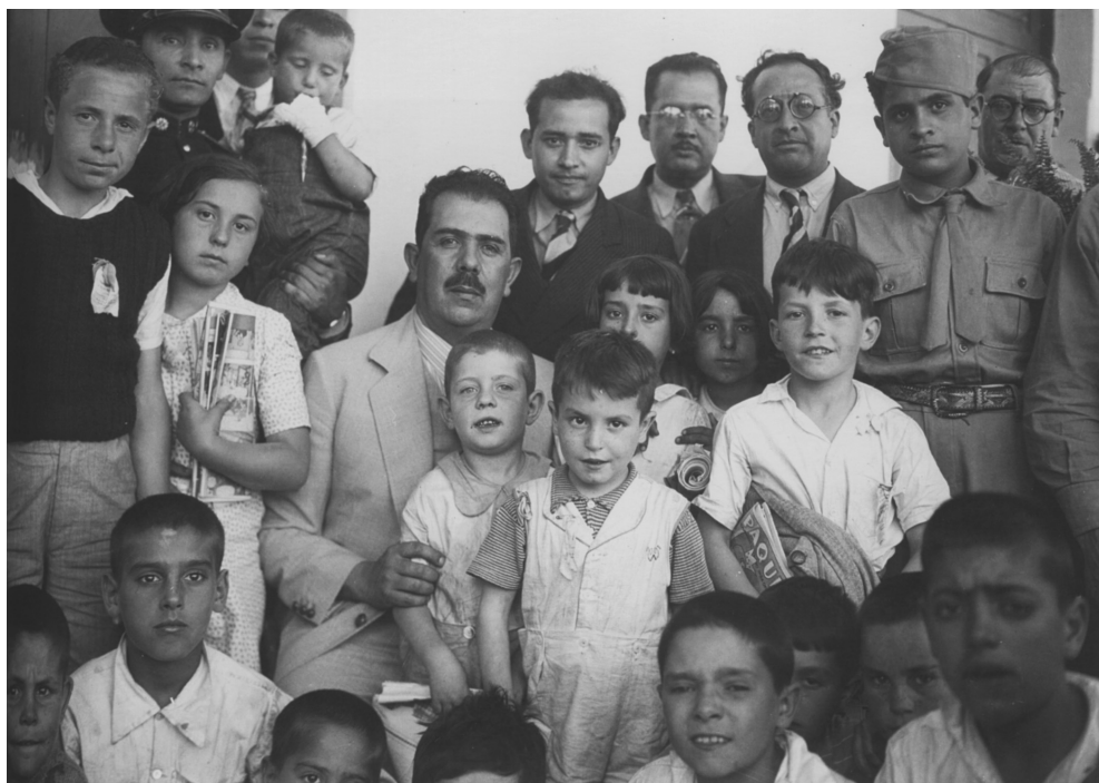
Los niños españoles refugiados y el presidente Lázaro Cárdenas, Ciudad de México, junio de 1937.