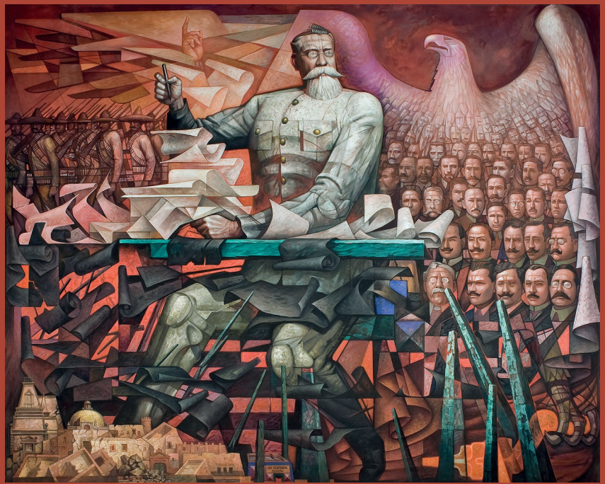
Jorge González Camarena: Venustiano Carranza y la Constitución de 1917 ,

MUSEO NACIONAL DE HISTORIA-INAH. Acrílico, 1967. 4.66 × 5.76 m.