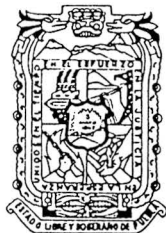
Estado de Puebla

13 de octubre de 2001, Teziutlán, Puebla