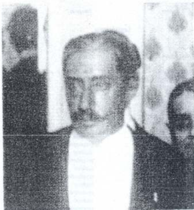
Juan Sánchez Azcona