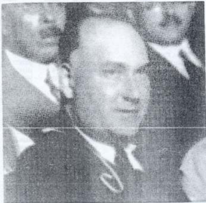
José Manuel Pulg Casauranc