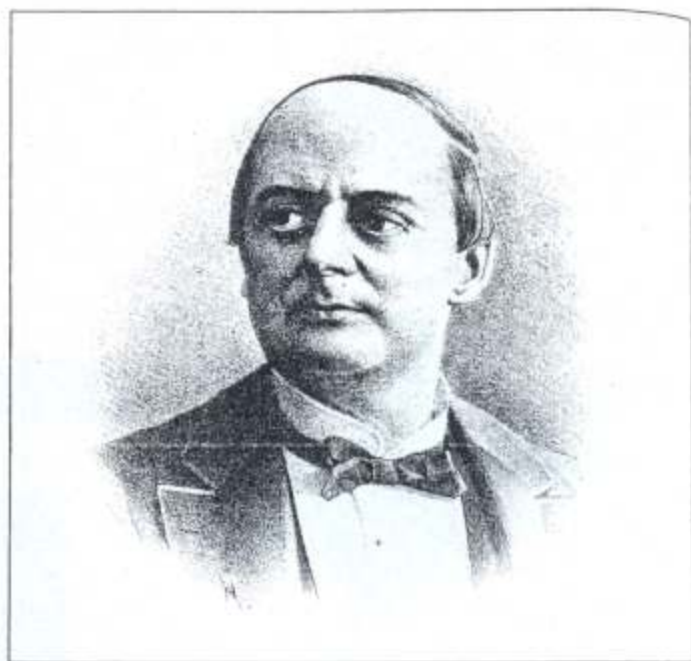
Sebastián Lerdo de Tejada