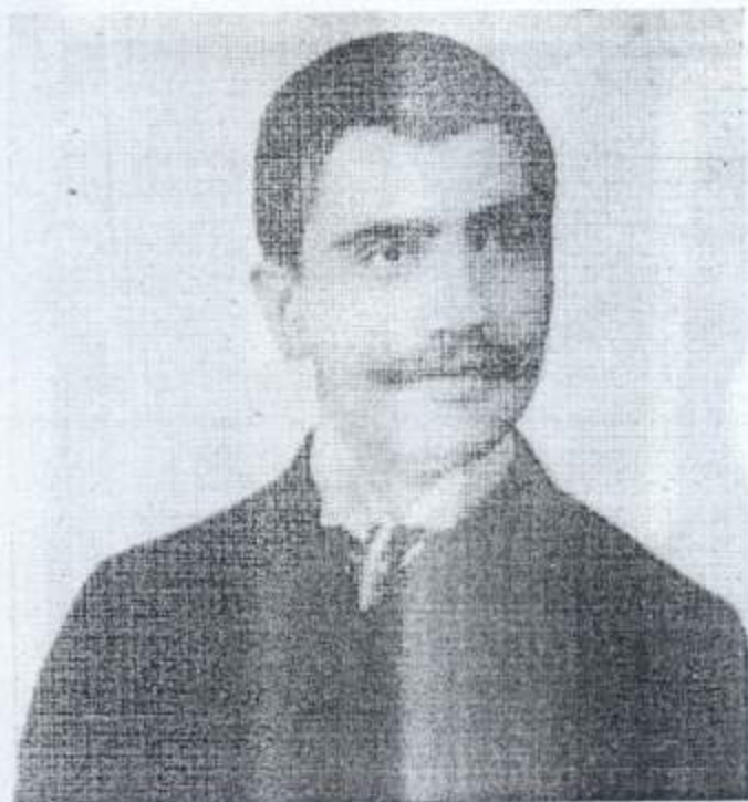
Victoriano Salado Alvarez