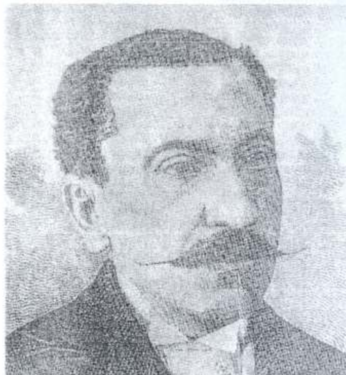
Manuel Gutiérrez Nájera