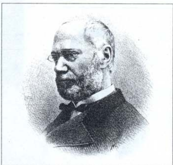
José María Iglesias