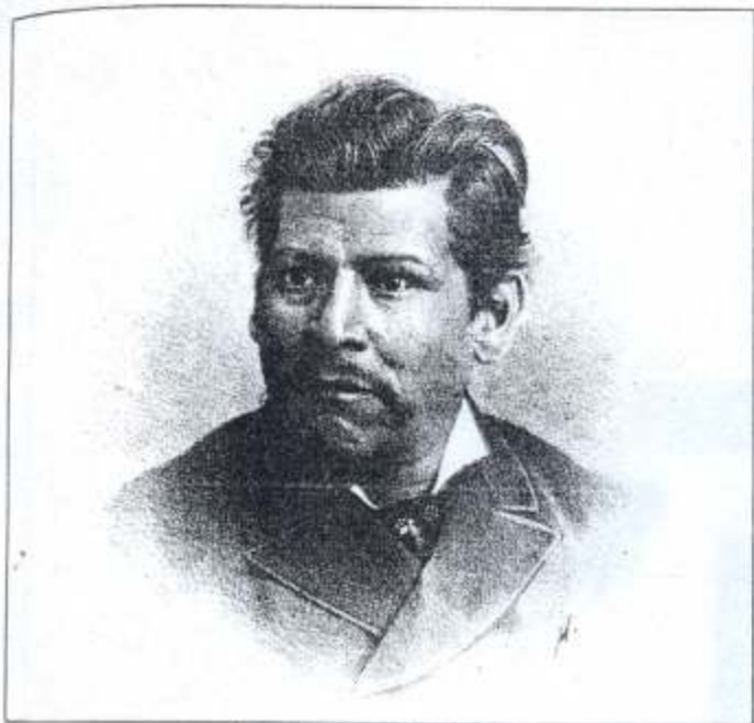
Ignacio Manuel Altamirano