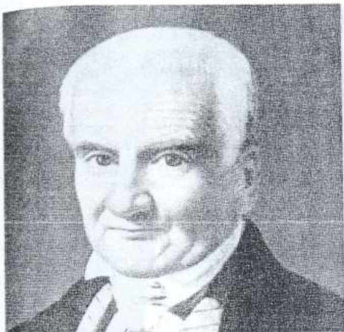
Carlos María de Bustamante