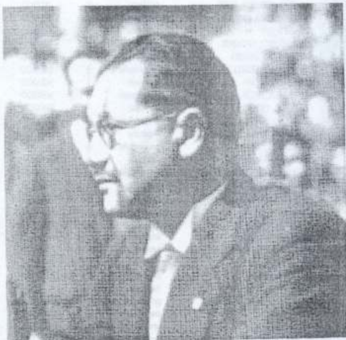
Marte R. Gómez