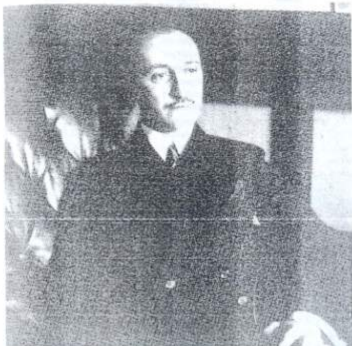
Félix F. Palavicini