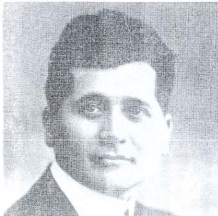
Felipe Carrillo Puerto