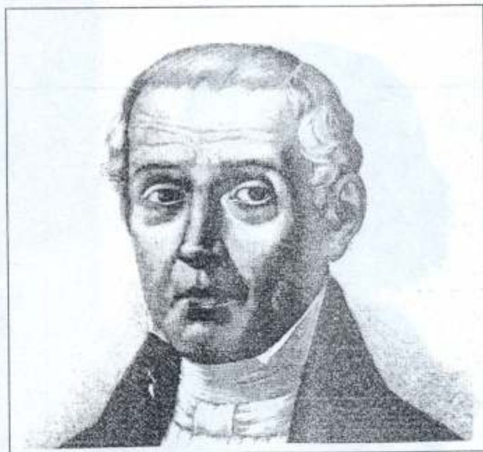
Valentín Gómez Farías