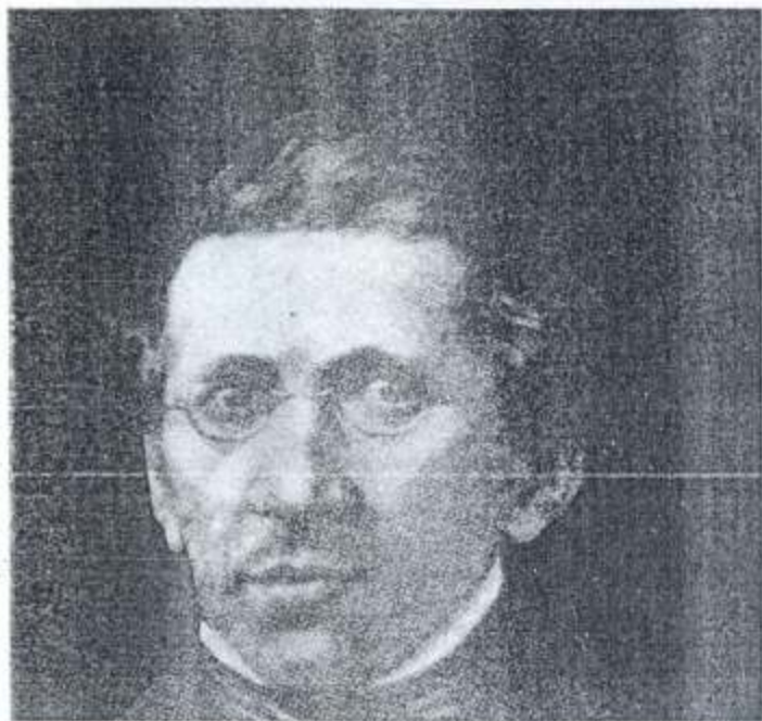
José María Lafragua