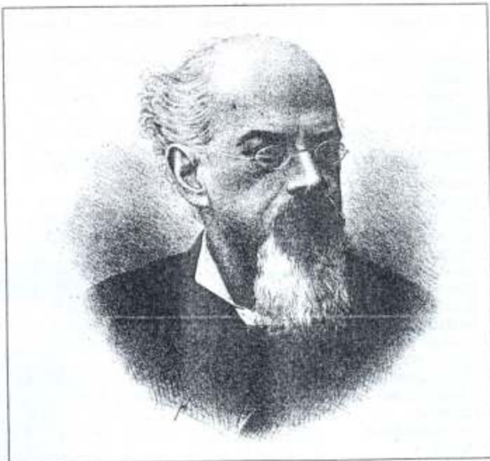
Vicente Riva Palacio