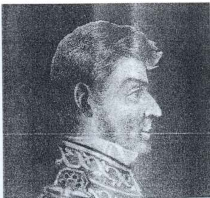
Ignacio López Rayón