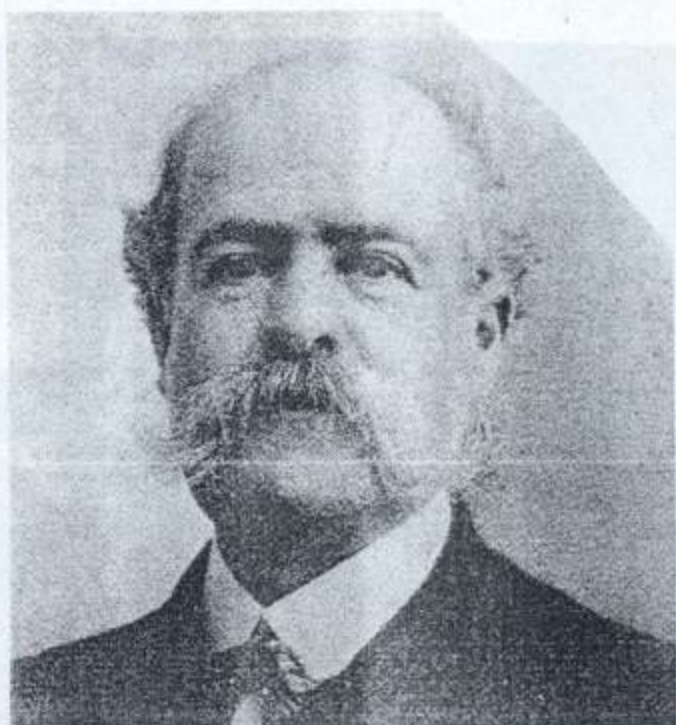
Juan de Dios Peza