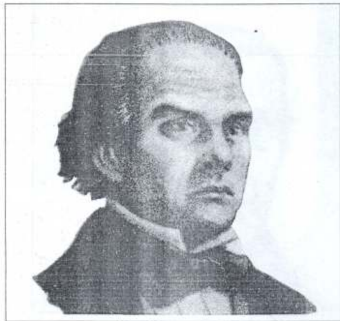
Manuel Crescencio Rejón