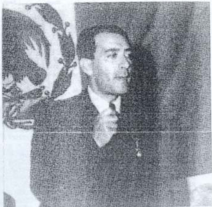
Vicente Lombardo Toledano