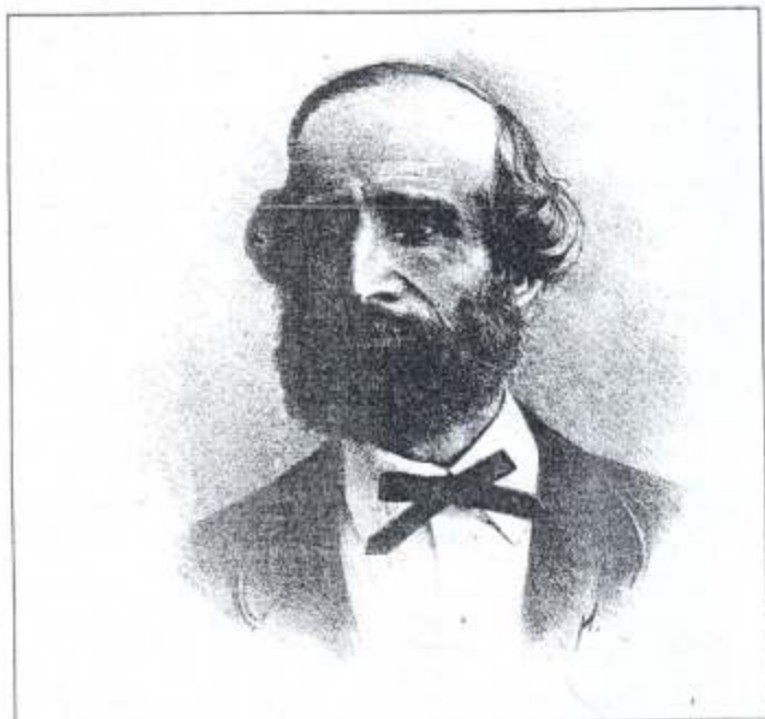
Manuel María de Zamacona