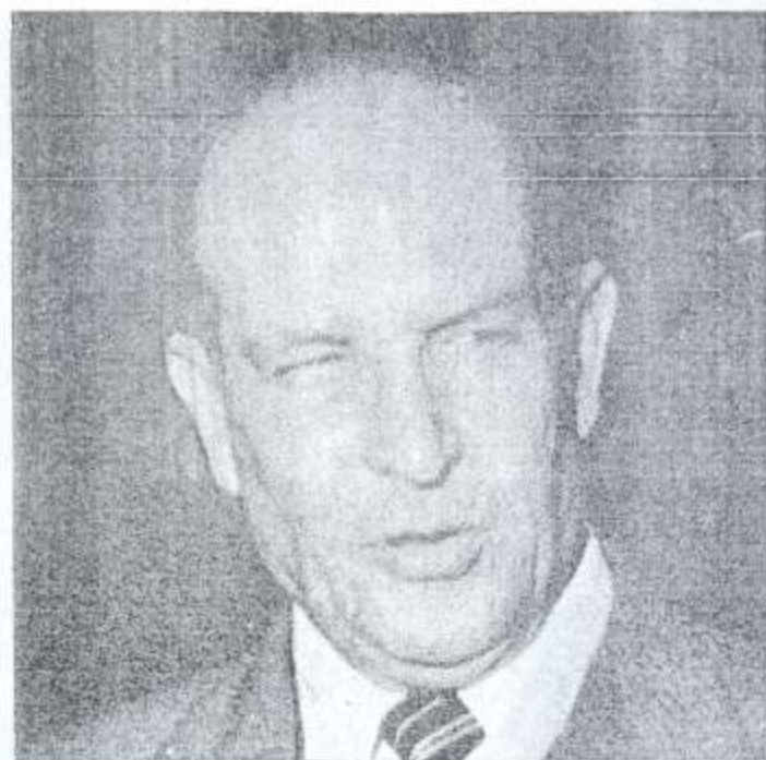
Efraín González Luna