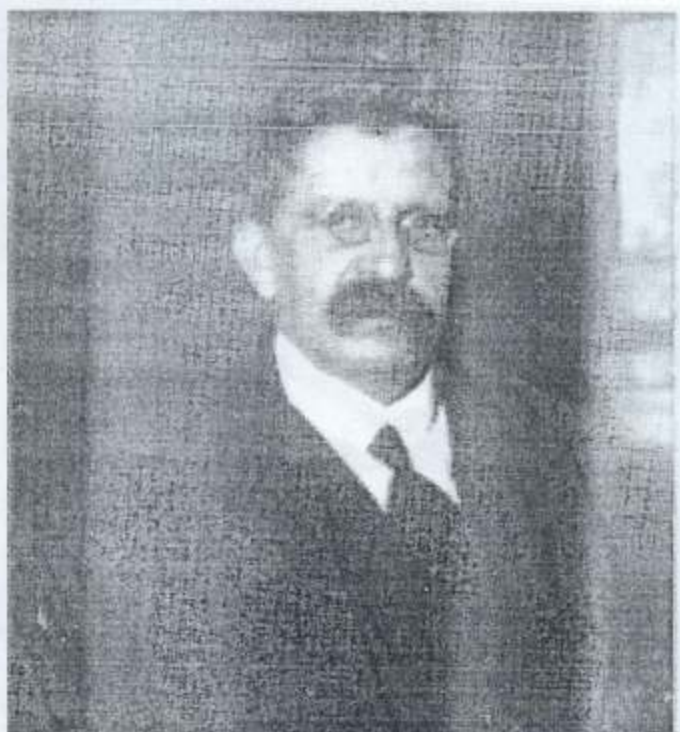
Salvador Díaz Mirón