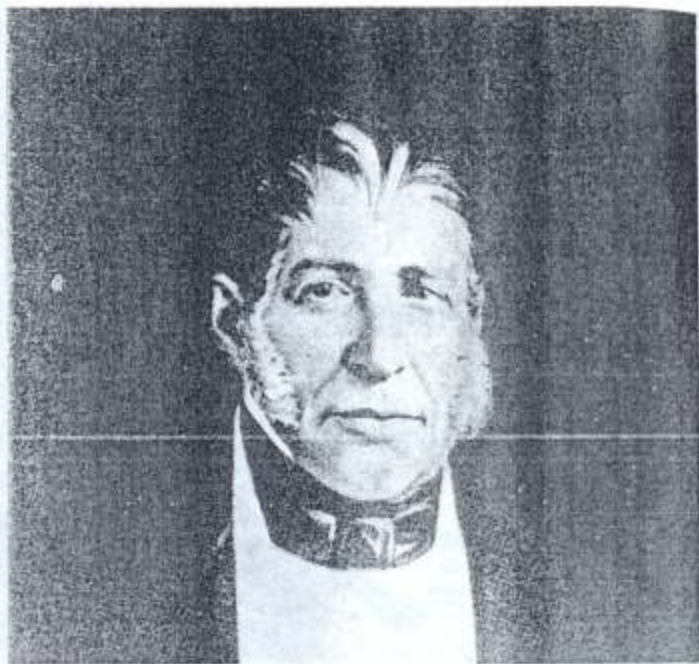
José Joaquín Herrera