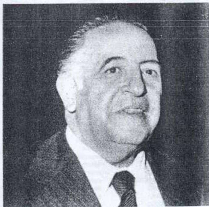
Jesús Reyes Heróles