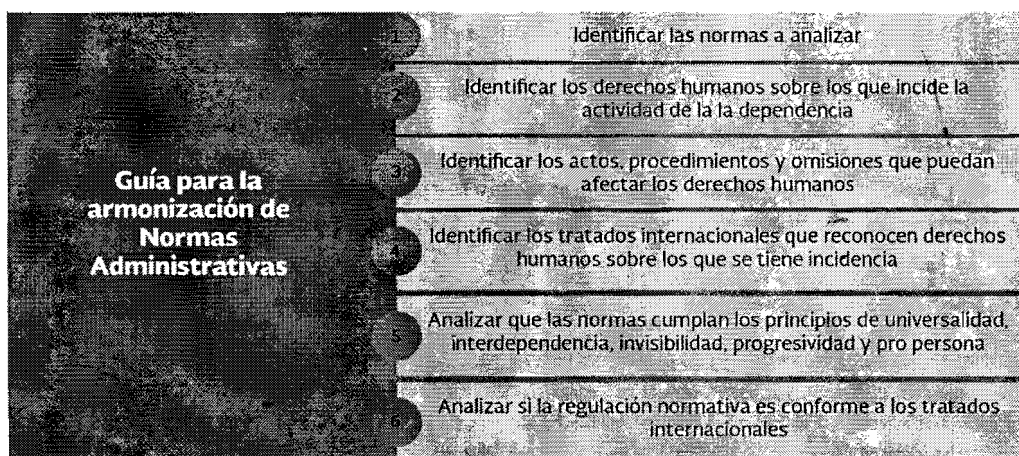
Cuadro 3. Guía para la armonización de normas administrativas

Los resultados de la primera revisión fueron sistematizados y presentados en una Sesión Plenaria de la Mesa.