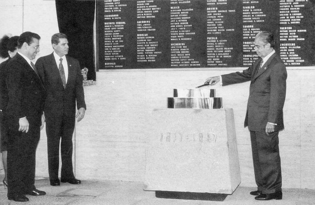
Develación de la placa conmemorativa en honor a los 218 Constituyentes de 1917, en la Plaza de la República del Palacio Legislativo de San Lázaro.