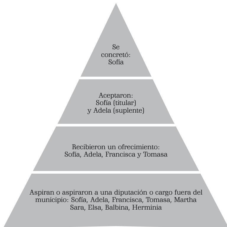
Figura 4 La pirámide de aspiraciones políticas