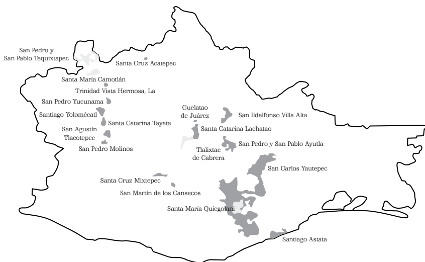
Figura 2 Municipios gobernados por mujeres, 1996-2010