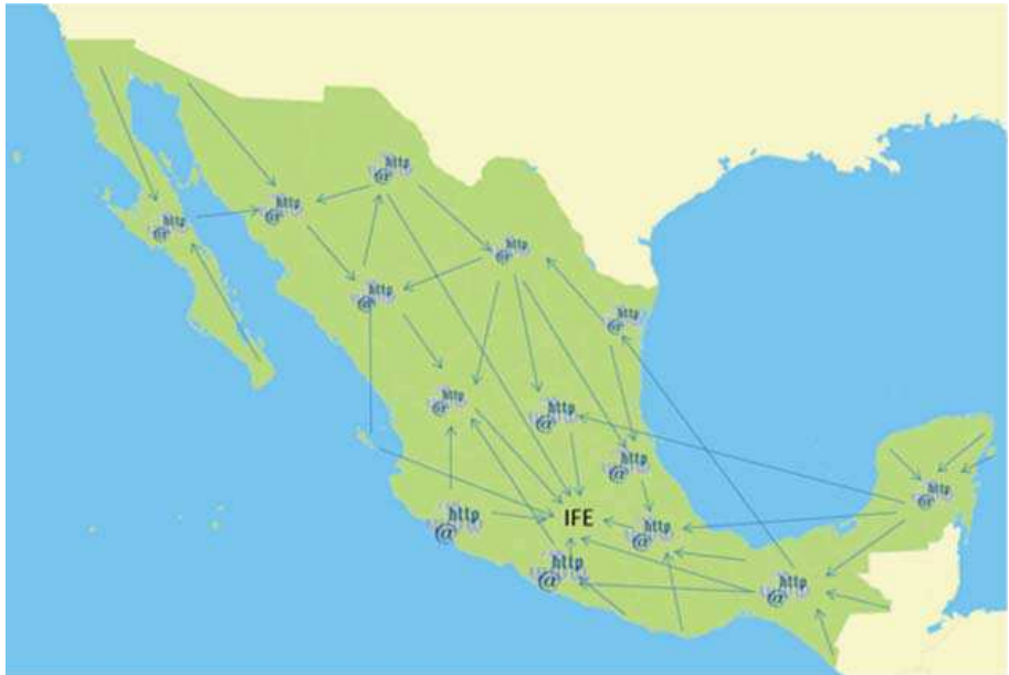
Transmisión y control de datos al IFE en el Distrito Federal.