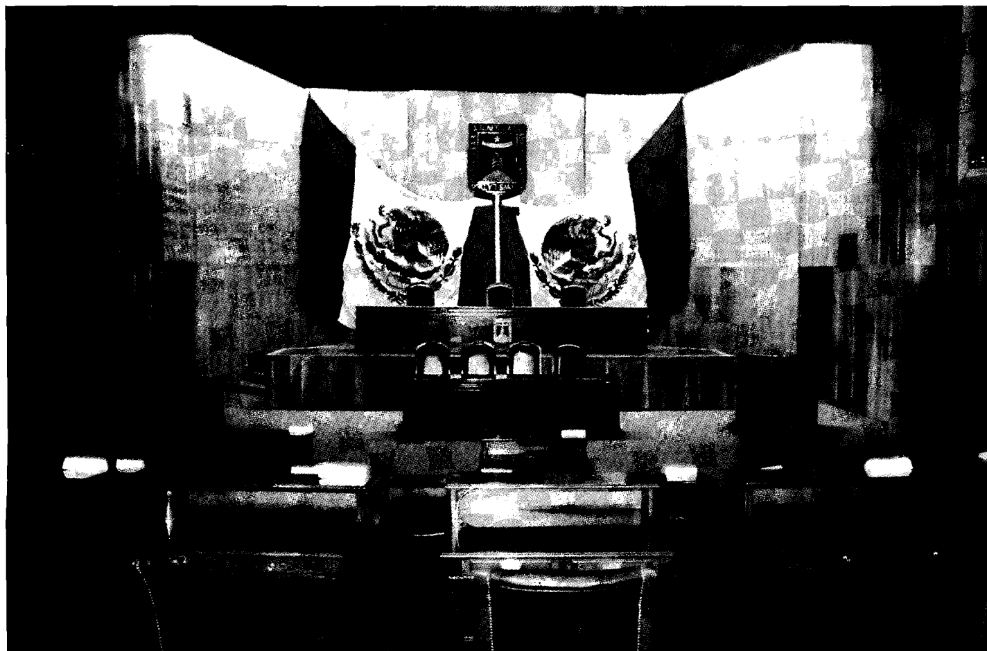
Vista frontal del foro del Salón de Sesiones del Palacio Legislativo del estado de Morelos