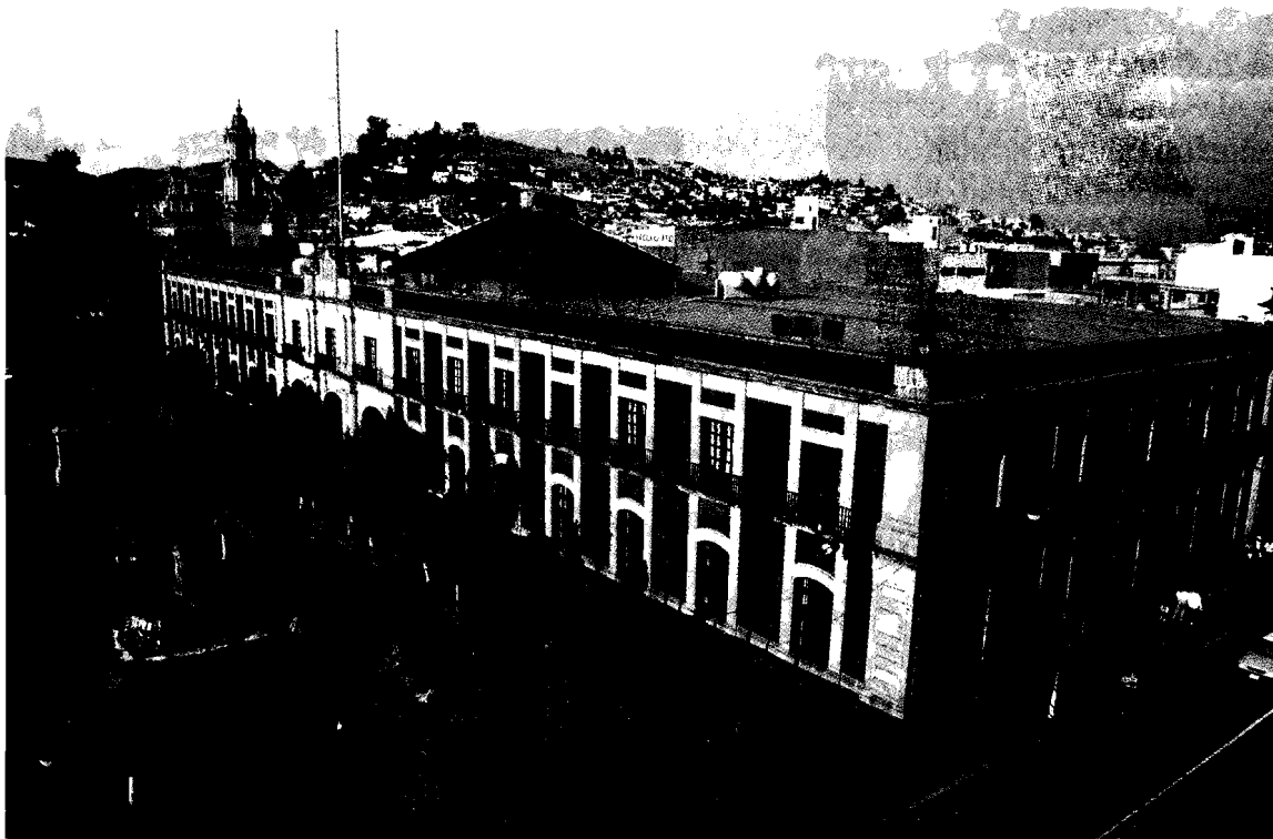
Fachada del Edificio del Poder Legislativo del estado de México