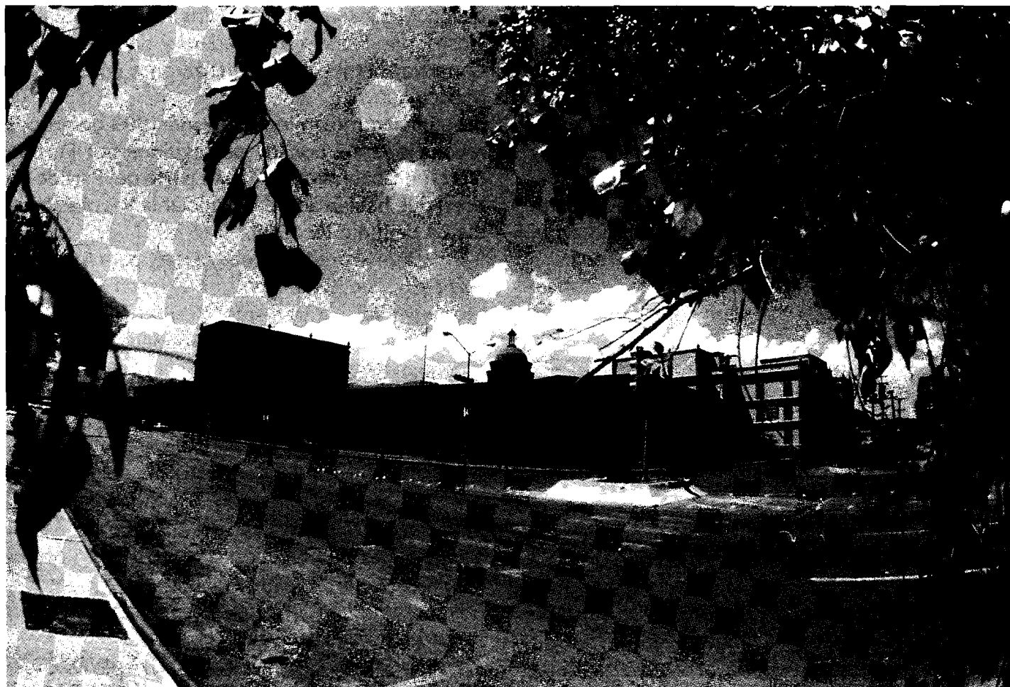
Congreso del estado

de la Nueva Tlaxcala, el 5 de julio, se jura la Independencia en Parras y Monclova. Coahuila es una provincia libre.