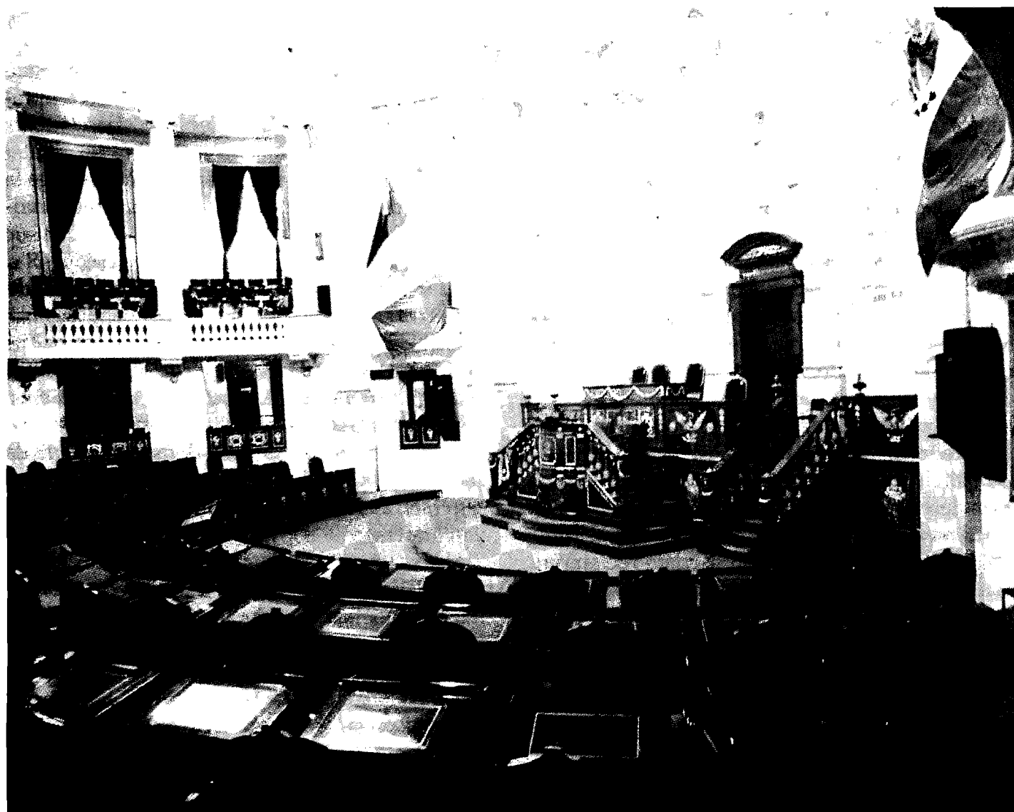
Salón de Sesiones de la Asamblea de Representantes del Distrito Federal