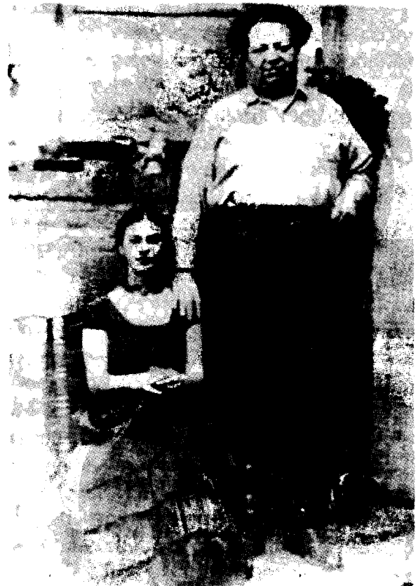
Frida Kahlo y Diego Rivera

http://www.uam.mx/difusión/comcul/inicio.html y cuenta con correo electrónico para recibir mensajes.