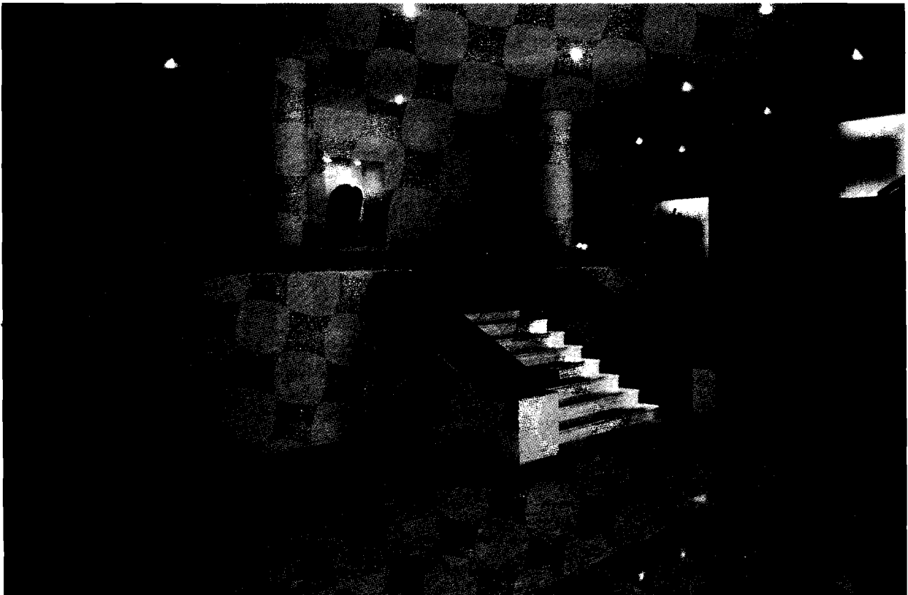
Vestíbulo del Recinto Oficial del Poder Legislativo

Resulta innegable que la cooperación, comunicación e intercambio de experiencias entre ambos cuerpos legislativos habrán de fortalecer en todos los renglones de la materia, las funciones que les son propias; para ello, es propósito fundamental del Honorable Congreso del Estado de San Luis Potosí, continuar impulsando en la medida en que se haga necesario, el vínculo formal que en ese sentido ha venido procurando de todos los Poderes que constituyen el Sistema Legislativo Mexicano.