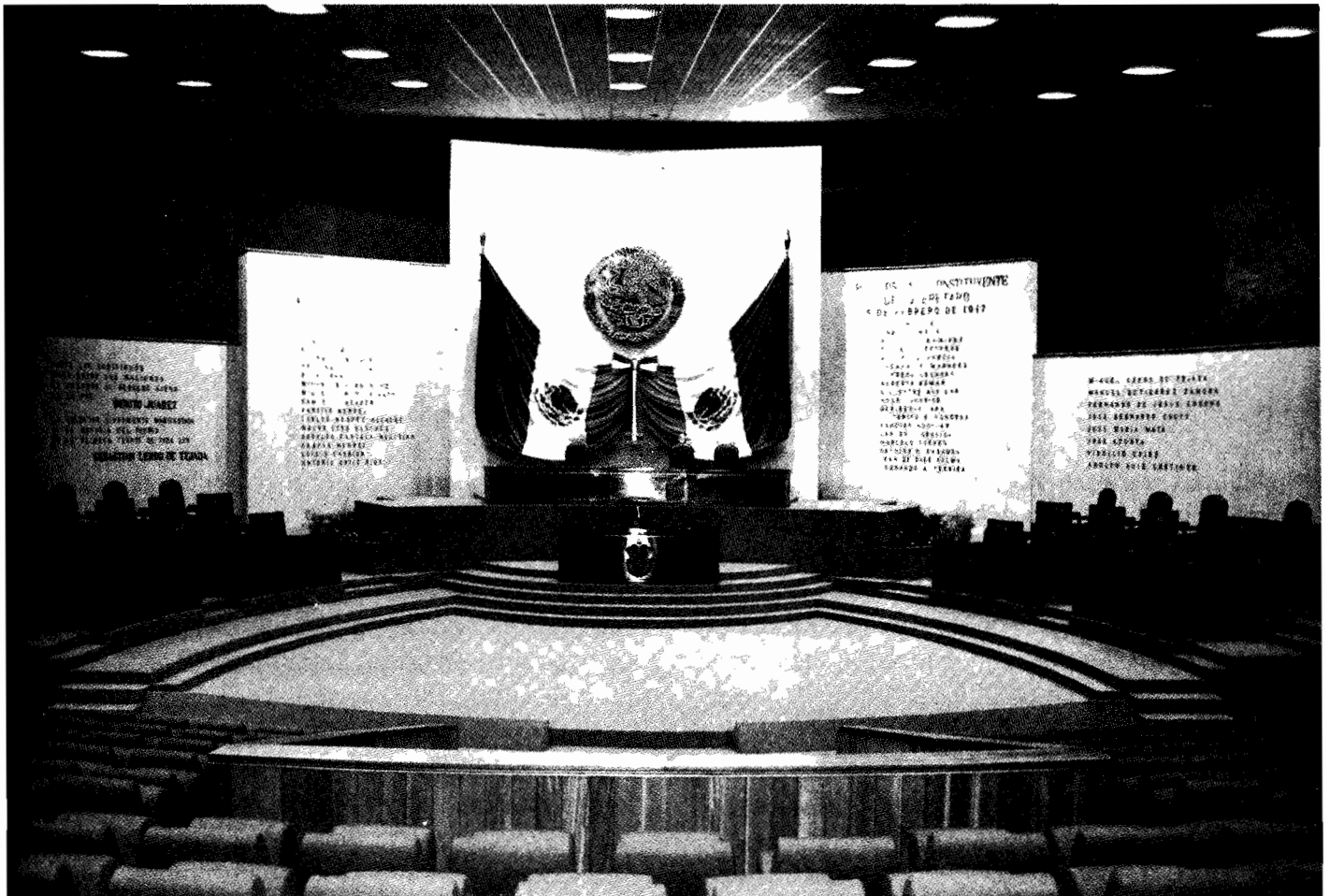
Salón del Sesiones del Congreso de Veracruz - Llave

producen los textos de las Cartas Fundamentales que, se dice, han tenido vigencia en Veracruz y sus reformas desde 1825 hasta 1917. 7