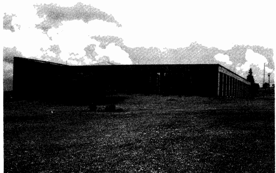
Fachada lateral del edificio del Congreso