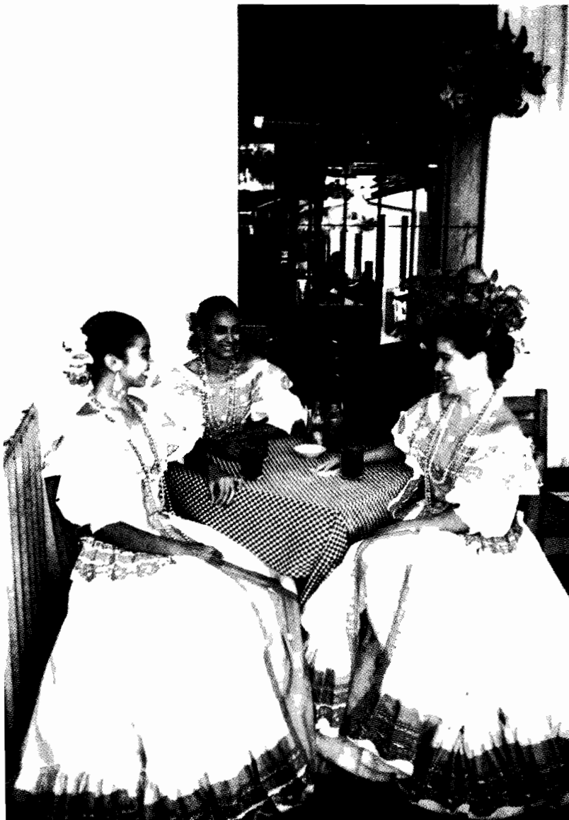
Folklore colimense; Comala, Colima

También la mujer ha tenido gran participación en el Congreso local, en 1967, fue electa la primera diputada, a partir de esa Legislatura las mujeres han formado parte del Poder Legislativo.