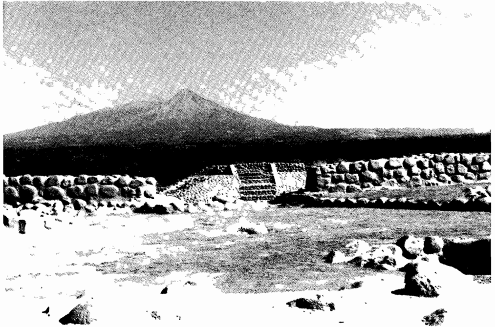
Zona arqueológica "La Campana"

Durante las décadas de los años treinta y cuarenta, varía la actividad en el