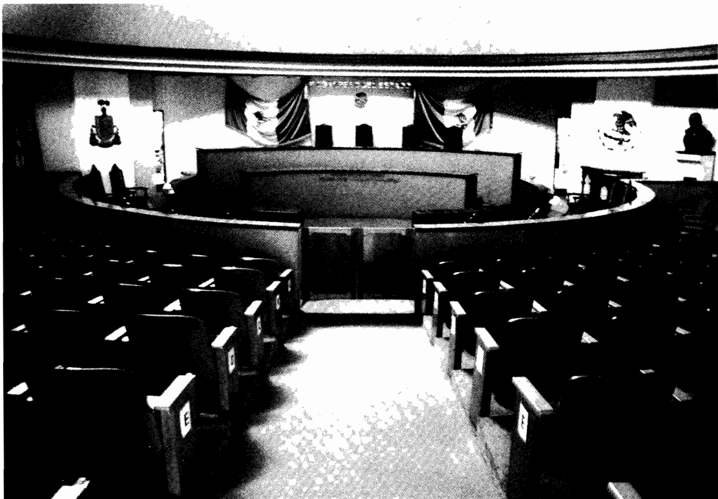
Interior del H. Congreso del Estado de Colima

nuestro tiempo, continúa trabajando en beneficio del pueblo a quien representa y por quien es electo.