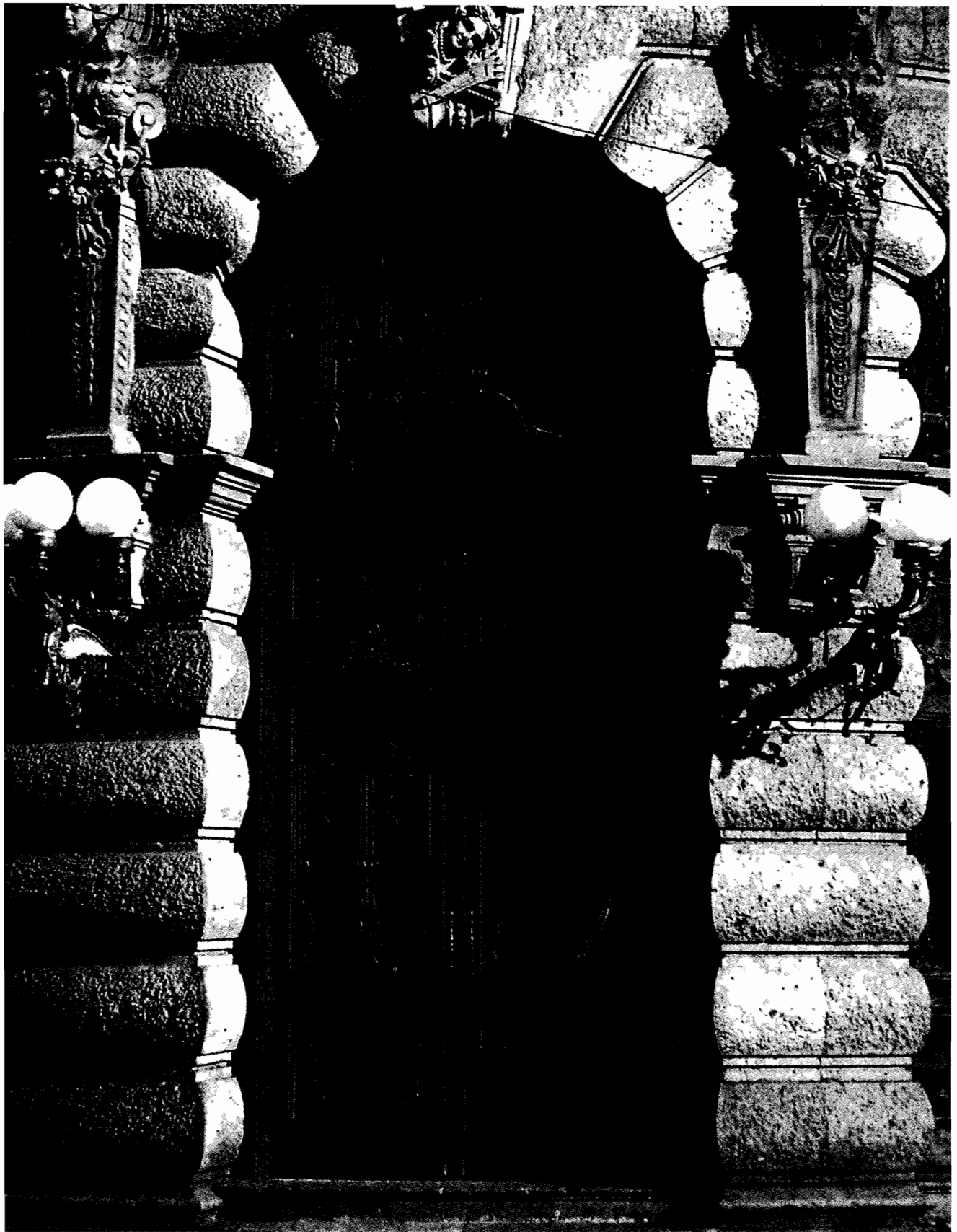
Puerta principal del teatro principal de Oaxaca, bautizado en honor del compositor Macedonio Alcalá