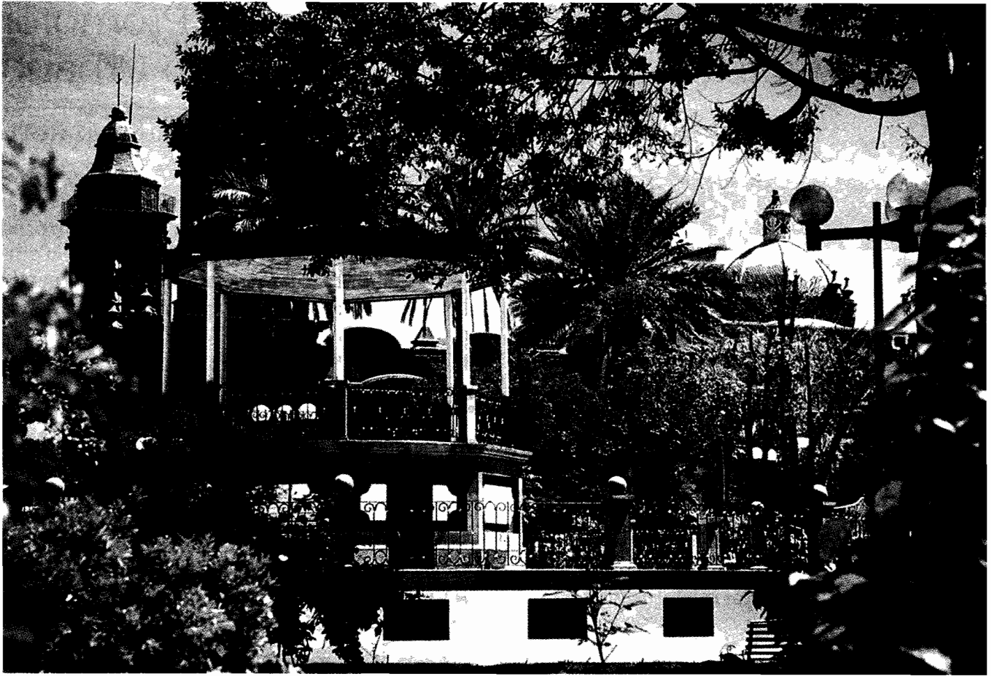
Kiosko del parque central de Huajapam. Al fondo se observan las cúpulas y el campanario de su templo recién reconstruido

El municipio es el indicado para diseñar las formas concretas de acción, pueden identificar el potencial local en qué cimentar sus iniciativas con vistas a un desarrollo sostenido, brindar el apoyo que requieren las iniciativas locales, promover los vínculos entre empresarios e instituciones para tratar de mejorar el sistema en su conjunto mediante un uso más eficiente de las posibilidades disponibles, organizar el mercado regional y diseñar servicios para la exportación e, identificar y formar a los empresarios potenciales.