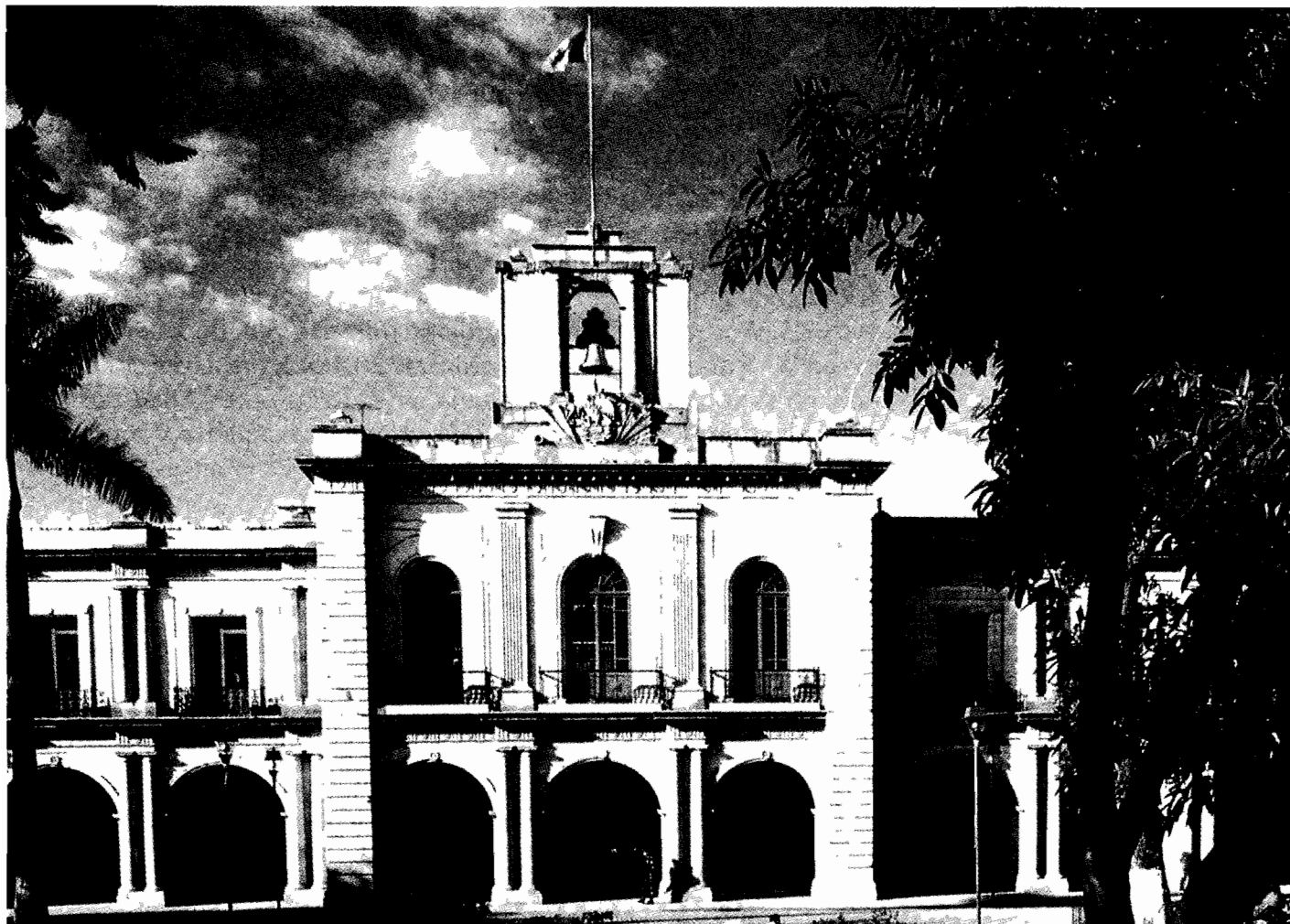
El Palácio de Gobierno estatal frente a la Plaza de la Constitución