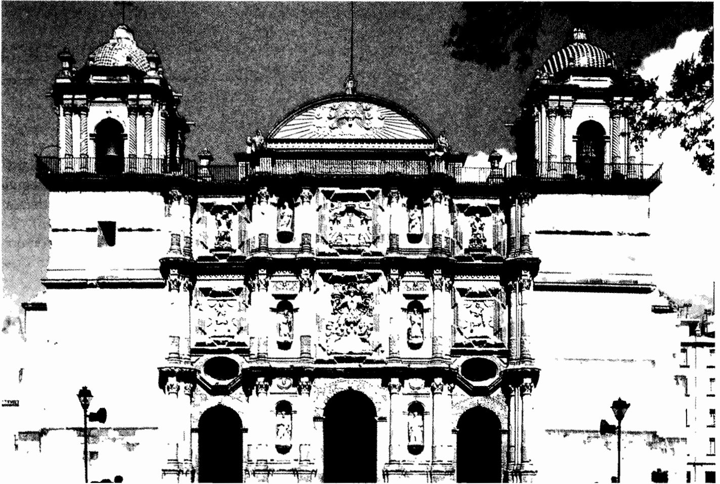
Hermoso espectáculo de la cantera labrada de la fachada de la Catedral

rra: resistió durante 111 días el sitio de los realistas, hasta que fue roto por Morelos. El Generalísimo hizo circular en Oaxaca El Correo del Sur y Don Vicente Guerrero mantuvo las guerrillas en esa región, acciones que dieron como resultado que en 1821, Antonio de León apoyara el Plan de Iguala y proclamara la Independencia.