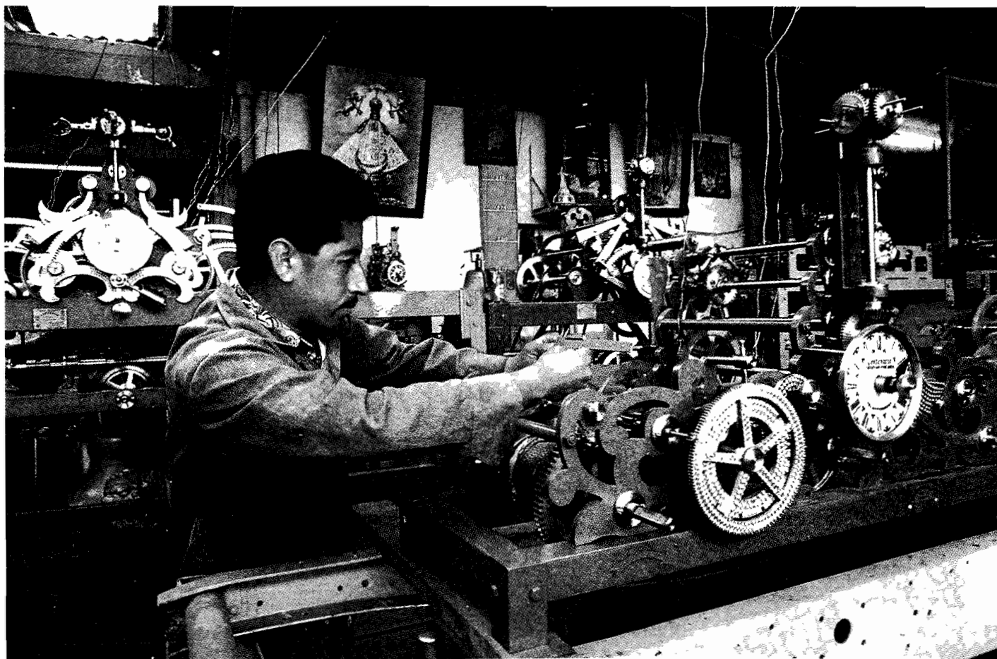
Carrillón y maquinaria de relojes

ral y en lo particular por 289 votos en pro y 160 votos en contra y por lo que respecta a las propuestas aceptadas por la Comisión se emitieron 390 votos en pro y por las demás propuestas 160 en pro y 289 en contra.