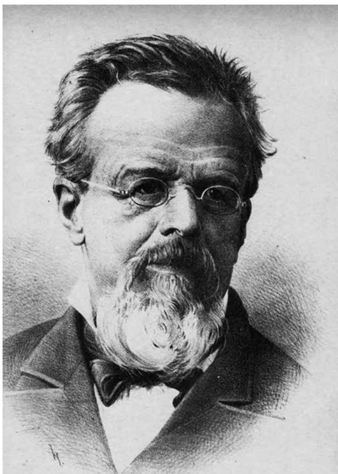
Diputado constituyente Guillermo Prieto.