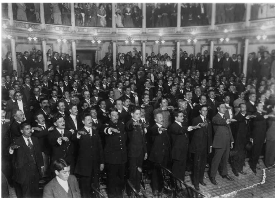
Los diputados constituyentes protestan la Constitución Política de los Estados Unidos Mexicanos, 31 de enero de 1917.