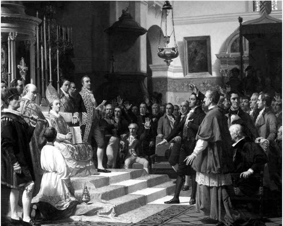
El juramento de las Cortes de Cádiz de 1810 (José Casado del Alisal, 1863). Cuadro expuesto en el Congreso de los Diputados de España.