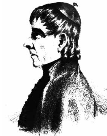
Constituyente Servando Teresa de Mier Noriega y Guerra