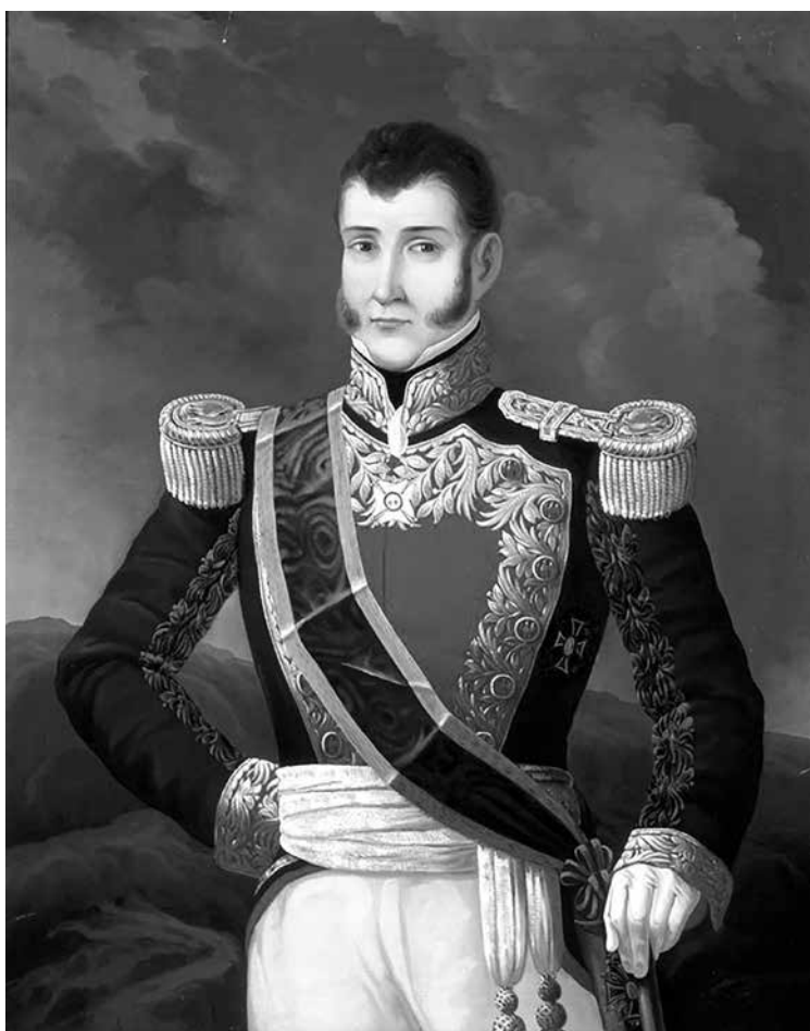
Agustín de Iturbide al óleo. Museo Soumaya de la Fundación Carlos Slim.