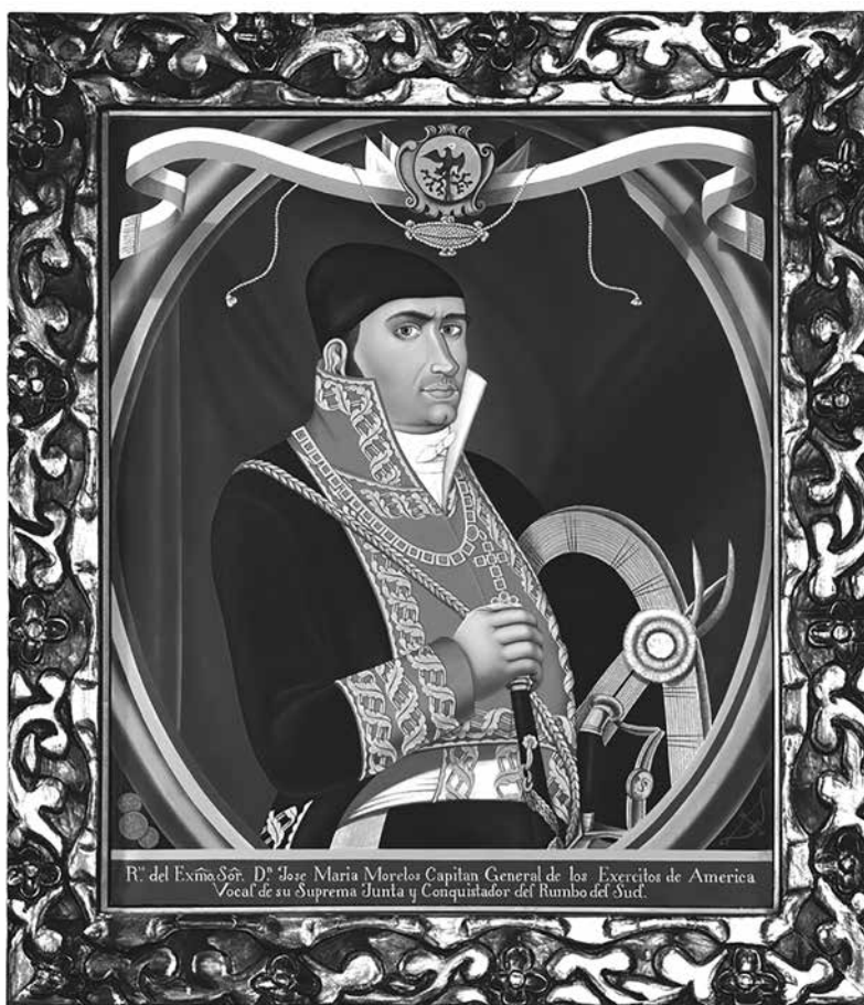
El Generalísimo José María Morelos y Pavón.